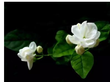
La nuit de Saint-Paul (1958), à gauche, et La nuit par la fenêtre (1950), milieu, de Marc Chagall, Jasmin (photo de Yang Xi) (à droite)