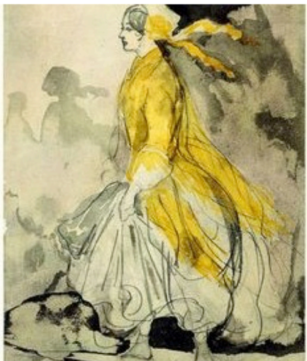
Constantin Guys, 1 ère édition du Peintre de la vie moderne de Baudelaire, 1863